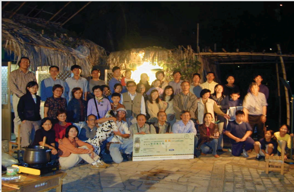
福特環保獎義工合照圖

現在的“洲仔溼地”雖不是一個稱得上標竿範例，但處身在典型都會區高樓大廈四面環繞中，從平地上，由環保綠色團體結合學術界及一群生態義工以“NGO”方式抵手拚足而成。以自籌經費方式，匯集點滴財源；加上熱愛這塊土地的信念，保護和我們生活在一起的生物群為目標，提供一個以動物為主人類為輔的棲息地，並建構一個人與動物和協相處。能夠共同使用的環境，孕育出新的生活需求指標與模式。而成為“都會區新典範”。